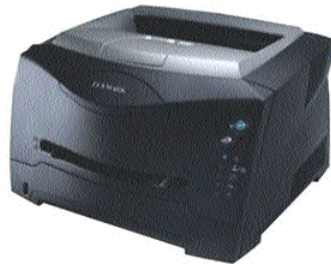
Une imprimante pour vos reçus et vos rapports de télétransmission