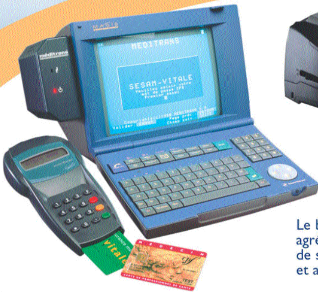
Le lecteur de carte Sesam Vitale compatible carte bancaire